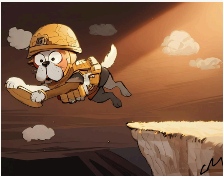
מה יותר קיצוני, המציאות של לוינסון או המציאות שלנו? איור: לירון רודיק

ואולי דווקא בימינו צריך יצירות סאטיריות כמו "לכשכש בכלב". סרטי פוליטיקה כאלה יכולים ללמד יוצרים צעירים כיצד לייצר גרסה סאטירית של המציאות שלנו. האם נמשיך להזין כך את התרבות הקיצונית שאנחנו בכל מקרה צורכים? כנראה שכן. אך כל עוד אנחנו חיים במצב טורבו, הסאטירה שלנו צריכה להתאים לכך. וכדי שזה יקרה – תצפו ב-"לכשכש בכלב", זה בהחלט צעד ראשון בדרך הנכונה.