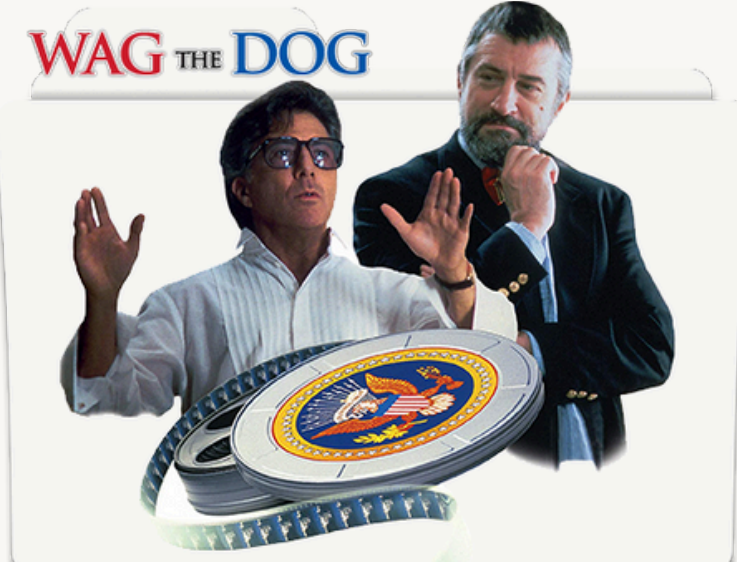
הסרט "לכשכש בכלב".