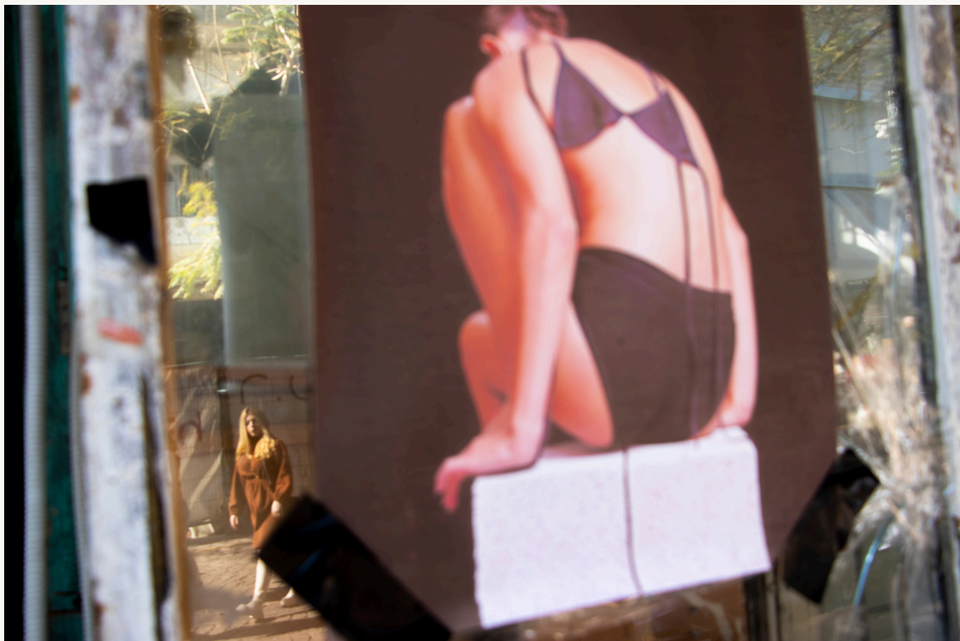
את לא אשמה, היא אומרת.