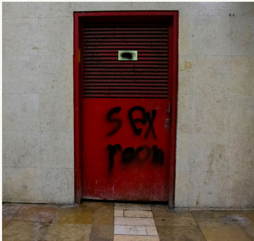
לעצור לפני דלת אדומה ובכל זאת לפתוח אותה, להציץ במה שלא טובל.

אנחנו חיים בעידן בו מספקים לנו אזהרות טריגר שתפקידן לשמור עלינו מפני תכנים קשים ולספק לנו תחושה בטוחה. אבל יתכן שהן מונעות מאיתנו חוסן נפשי?