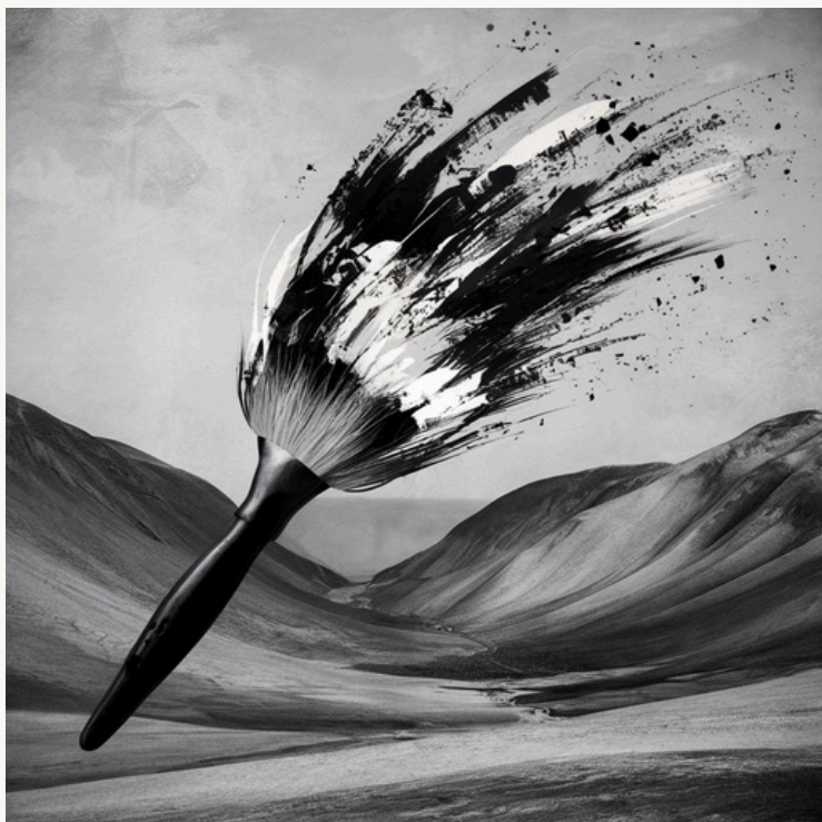
אצלנו אין גננים ראויים.

טסתי לצד השני של הכדור, לעמוד על סף תהום ולהביט בשקיעה מלמטה, כי תאמינו או לא, עובש וריקבון מתפשטים כשהאדמה לא מטופלת.