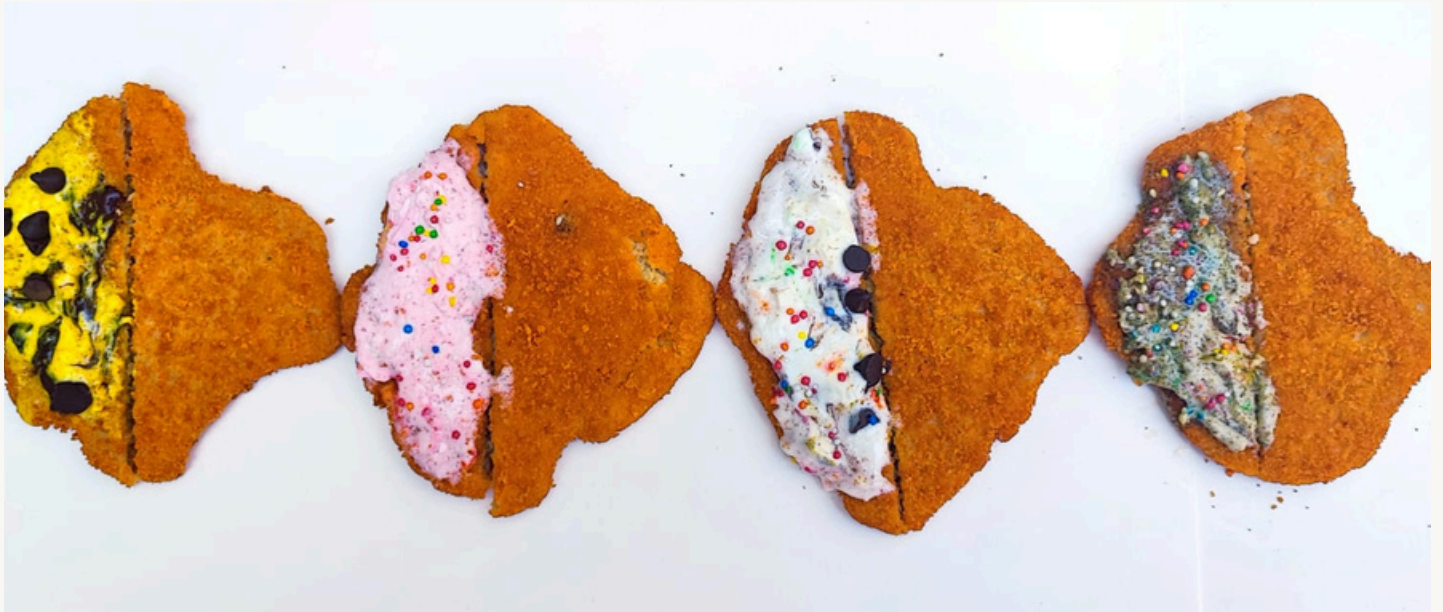
ראיתי שמכרו שם קרואסונים מעוכים או בשמם הנוצרי, "קרואסונים קוריאניים". דימוי: סופיה הרננדז