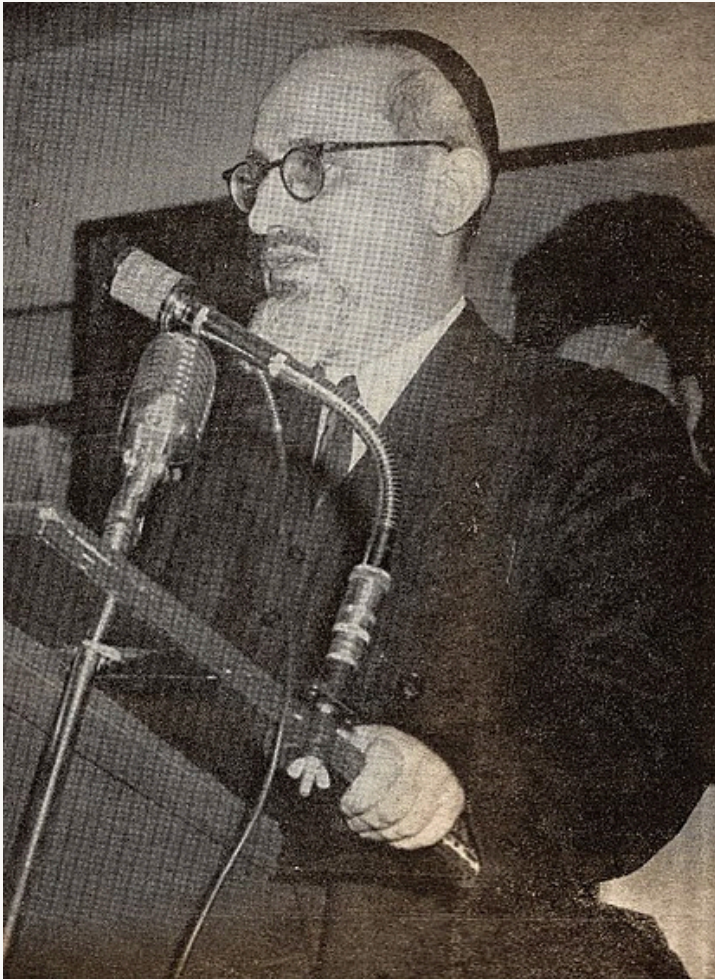
הרב דב יוסף הלוי סולובייצ'יק.

אנו אמנם נולדים ומתים בעל כורחנו, אך חיים ברצוננו החופשי. הרב סולובייצ'יק מציע לנקוט בגישה אחראית ובוגרת שתעזור למצוא פֶּשֶׁר לתלאות הקיום