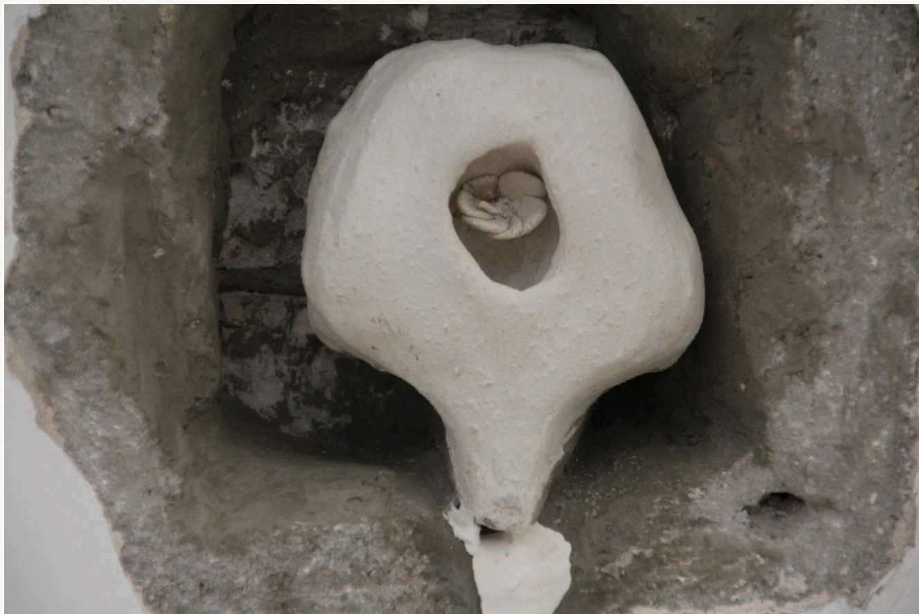
אליאב זמור. 2021. טכניקה מעורבת חימר, גבס וחציבה בקיר.

אחת משבע נשים בגילאי הפוריות סובלת מתסמונת הנקראת וולוודיניה*, כאבים כרוניים בפות. לפי הארגון הבינלאומי למחלות הפות והנרתיק (ISSVD), כאב המאובחן כתוצאה מוולוודיניה כשהוא זה שנמשך שלושה חודשים ומעלה ושלא נמצאו לו סיבות פתולוגיות. וולויה פירושה "פוח" ודיניה פירושה "כאב". שם המחלה הוא שם התסמינים.